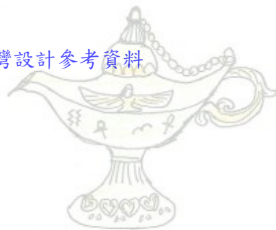
回港灣設計參考資料